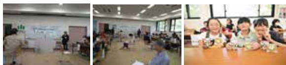
子どもクイズ大会 令和5年8月26日(土) 9:00~12:00 優勝賞：八幡小学校

子どもたちにクイズを通じて、近江八幡のあらゆる分野のことを学んでもらうことで、自分の住んでいる地域を再発見してもらえればと、びわこ揚水土地改良区にて開催しました。市内の小学3年生から6年生までを対象に、3人1組で参加募集したところ、18組54人の応募がありました。当日は1組の欠席もなく、ご家族が見守る中で、白熱したチーム戦が繰り広げられました。予選では、決勝に進める10チームを目指して、3択の読上げ問題に挑戦してもらいました。決勝に進んだ10チームで、間違えれば終わりの○×問題で上位チームが決まりました。予選、決勝とも、チームワーク良く真剣に問題に取り組み、正解を聞くたびに一喜一憂する子どもたちの楽しそうな姿が印象的でした。また、チーム戦の前には、ウォームアップ問題として、30問の筆記式のクイズに参加者全員で挑戦してもらいました。この問題で70%以上正解すると、あづち・はちまんふるさと検定の初級を合格したものとし、10人の子どもたちが合格しました。尚、びわこ揚水土地改良区に協賛いただいて、上位チームの賞品に使わせてもらいました。今後も、内容を工夫しながら実施していければと考えています。