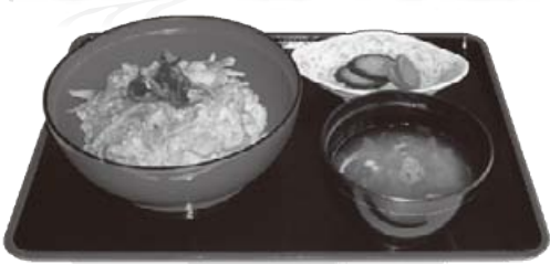
新左衛門弁(季節替わり) ¥680