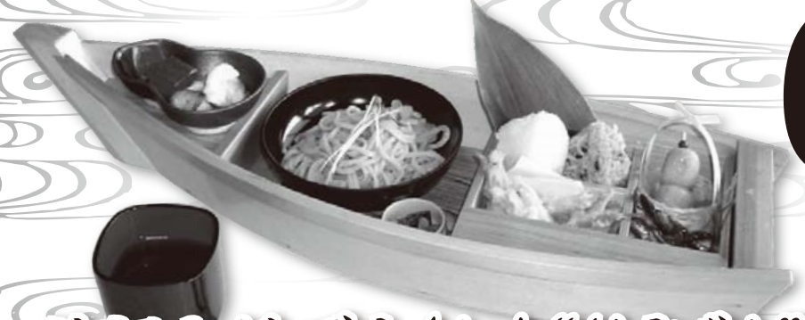
近江八幡で生まれた“よしうどん”