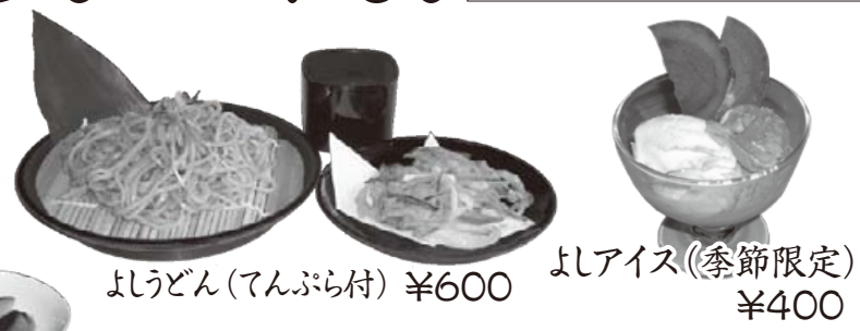
よしうどん(あんばら付) ¥600 よしアイス(季節限定) ¥400