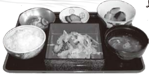
新左衛門定食(季節替わり) ¥780

ヨシは水郷の風物詩を作り上げるだけでなく、窒素やリンの吸収による水質浄化に加え、水鳥や魚の生息、繁殖の場所となり琵琶湖の生態系の保全に重要な役割を果たしており、「ヨシ1本で水1トンを浄化する」といわれています。 近江八幡のヨシは昔からスダレや衝立等の材料に利用されてきました。近年、伝統産業から食材産業へ発想の転換でヨシの食品が各種開発されています。そして近江八幡の名産として登場したのが、ヨシうどんやヨシせんべいです。太陽をいっぱい浴びビタミンCを多く含んだ食品です。「新左衛門」ではヨシを食材として使用したメニューをお出ししています。 近江八幡の素晴らしい水郷風景と共に琵琶湖や環境、地域を再認識していただけることを願い、心を込めてお届けします。